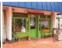
VITA RICCA (徒歩10分/約800m)