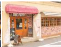
あがほ珈琲 (徒歩5分/約350m)