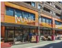
オオセキ旗の台店 (徒歩8分/約600m)