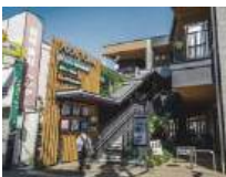
イオンタウン旗の台 (徒歩12分/約940m)