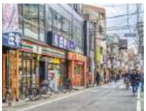
荏原町商店街 (徒歩7分/約560m)