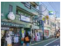
旗の台東口商店街 (徒歩12分/約900m)